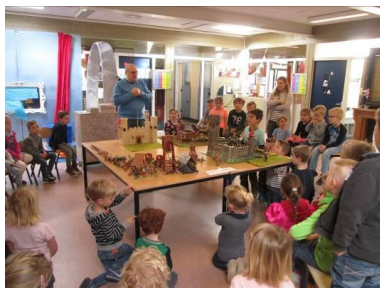
Ouder vertelt tijdens project Middeleeuwen over de verschillende soorten kastelen.

De MR van Rennevoirt overlegt ook met MR's van de andere scholen van Tangent. Dit gebeurt in de Gezamenlijke Medezeggenschapsraad.