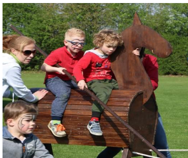
Afsluiting project Middeleeuwen met Ridderspelen dag

Met opmaak: Rechts, Tabstops: 8,25 cm, Left